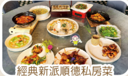
經典新派順德私房菜