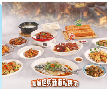
鳳城經典新派私房菜

第1天 深圳指定口岸集合→乘坐國內旅遊巴士午餐【 鳳城經典新派私房菜 】→2026重磅升級【廣州長隆水上樂園】超級全球玩水圈正式啟航★玩轉全新五大洲主題(東南亞玩水圈、亞馬遜雨林圈、西歐盛夏圈、熱辣拉丁圈、夏威夷沙灘圈)70+闖家歡玩水設備組成巔峰設備→長隆水上樂園必玩三大世界級巔峰設備“風暴雙響炮”“沖天雙浪板”“磁力炮水上過山車”→晚餐【 敬請貴賓與園區自理 】→國際水上電音狂歡派對→返回酒店大概30分鐘車程