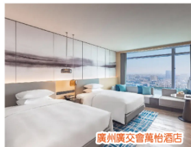
廣州廣交會萬怡酒店