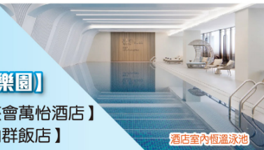
酒店室內恆溫泳池

保證入住萬豪集團旗下【廣州廣交會萬怡酒店】 連續八年蟬聯米芝蓮推介餐廳【向群飯店】