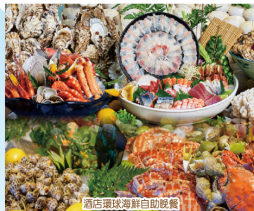
酒店環球海鮮自助晚餐

第1天 、深圳指定口岸集合→乘坐國內旅遊巴→提前入住酒店(保證入住約500呎180°豪華正海景露台浴缸房*暖心安排一次性浴缸套)→特別安排酒店精美海景下午茶(每人一杯飲品+精緻甜品)→打卡網紅巴厘島同款「天空之鏡」4萬呎無邊際泳池、戶外泳池、室內恆溫泳池、兒童泳池、健身房；暢玩室內兒童俱樂部「大梅沙趣趣島主題兒童活動」→晚餐【酒店環球海鮮自助晚餐】→自由漫步大梅沙絕佳海景、享受2km金色沙灘