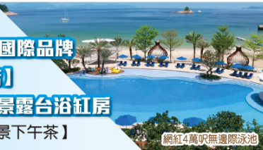
網紅4萬呎無邊際泳池