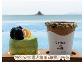
特別安排酒店精美海景下午茶