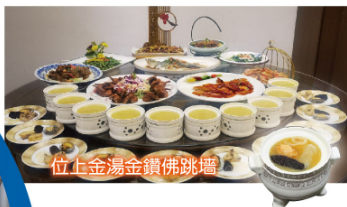
位上金湯金鑽佛跳牆