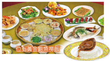
位上黃金鮑魚撈飯