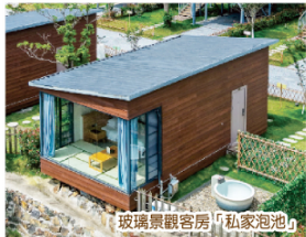
玻璃景觀客房「私家泡池」