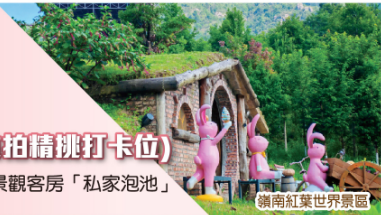
嶺南紅葉世界景區