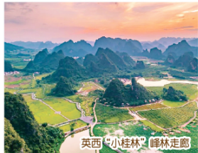
英西「小桂林」峰林走廊