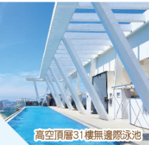
高空頂層31樓無邊際泳池