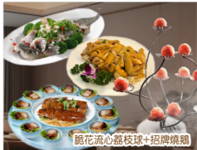
脆花流心荔枝球+招牌燒鵝