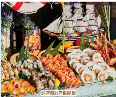
酒店海鮮自助晚餐

第1天 、指定口岸集合→乘坐國內旅遊巴→午餐【脆花流心荔枝球+招牌燒鵝】→入住酒店（保證入住高樓層正海景露台浴缸房，尊享私家露台浴缸紅草浴、配備浴缸套+睡眠眼罩）→酒店自助下午茶→自由享受31樓高空無邊際泳池、暢玩5大中心泳池群：船型無邊際泳池、萬畝園林泳池、兒童泳池、水上樂園（如泳池當天因維修或清洗關閉，視乎當天酒店安排）→晚餐【酒店海鮮自助晚餐】→特別安排沙灘篝火party（如因天氣因素影響取消，則改為酒店室內自由活動，恕我可不作另行通知）