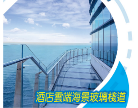
酒店雲端海景玻璃棧道