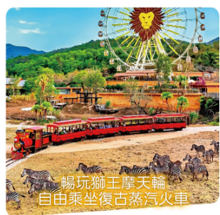
暢玩獅王摩天輪 自由乘坐復古蒸汽火車

酒店自助早餐 →自由活動或繼續享受酒店設施→午餐【 廣府粵菜臻品宴 】→繽紛夏日室內海洋館 〈東莞海立方環遊城〉 暢玩10萬呎巨型海洋王國→玩轉六大主題園區(曆奇部落/奇幻樂園/明日世界/海洋夢工廠/萌趣秋千島/冰極天地)→乘坐國內旅遊巴→送往深圳指定口岸解散