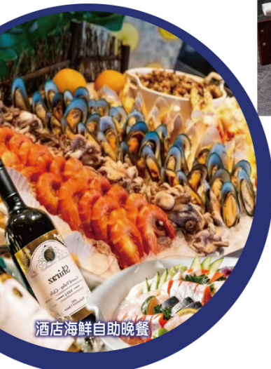
酒店海鮮自助晚餐

奢華度假國際品牌【深圳大梅沙京基洲際度假酒店】 保證入住約500呎豪華海景露台浴缸房 ★2025年9月全新開業【惠州中海希爾頓酒店】 尊享30樓以上獨立浴缸客房 豪華兩晚酒店海鮮自助晚餐 純玩3天