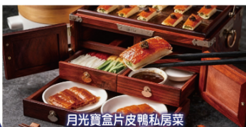
月光寶盒片皮鴨私房菜