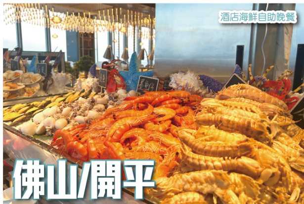
酒店海鮮自助晚餐