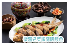
懷舊名菜順德釀鮫魚

第2天 酒店自助早餐→繼續打卡赤坎古鎮→午餐【 懷舊名菜順德釀鮫魚+經典霸王雞 】→重本包門票打卡佛山網紅景區《廣東宋城·千古情》觀看一生必看的演出·大型歌舞SHOW·5D實景沉浸式大型互動視覺藝術盛宴·玩轉億元打造大型嶺南韻味Show暢遊20+劇場特色主題街區→入住酒店《佛山源林酒店》房間配備Mini bar歡迎飲品→自由享受酒店設施→晚餐【 酒店海鮮自助晚餐 】→特別安排大航貴賓歡樂時光KTV·麻將任玩(數量有限先到先得)