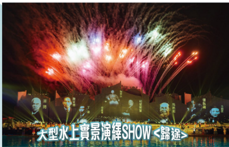
大型水上實景演繹SHOW <歸途>