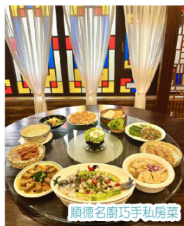
順德名廚巧手私房菜

第2天 酒店自助早餐→繼續打卡赤坎古鎮→午餐【 懷舊名菜順德釀鮫魚+經典霸王雞 】→重本包門票打卡佛山網紅景區《廣東宋城·千古情》觀看一生必看的演出·大型歌舞SHOW·5D實景沉浸式大型互動視覺藝術盛宴·玩轉億元打造大型嶺南韻味Show暢遊20+劇場特色主題街區→入住酒店《佛山源林酒店》房間配備Mini bar歡迎飲品→自由享受酒店設施→晚餐【 酒店海鮮自助晚餐 】→特別安排大航貴賓歡樂時光KTV·麻將任玩(數量有限先到先得)