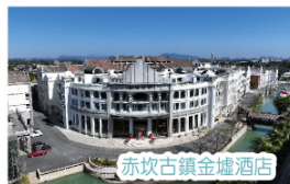
赤坎古鎮金墟酒店

備註：如因天氣或不可抗力等因素臨時關閉停演，恕我社不另行通知，景區所有表演請以當天公佈為準。