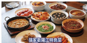
張家衛陽江特色菜