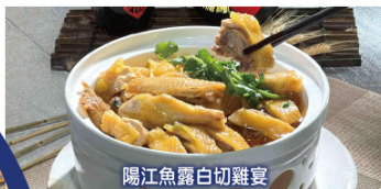
陽江魚露白切雞宴