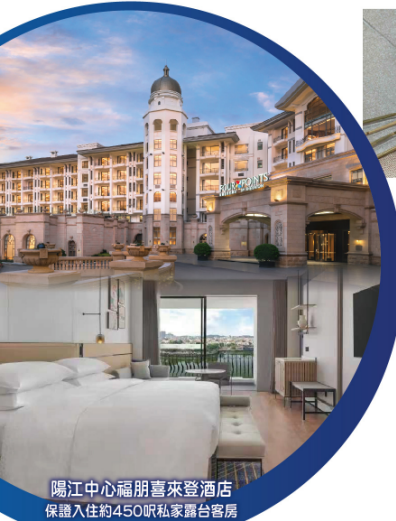
陽江中心福朋喜來登酒店 保證入住約450呎私家露台客房