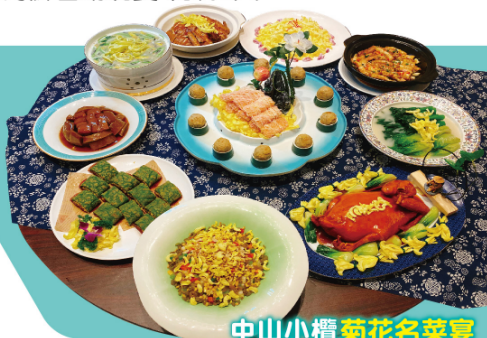
中山小橋菊花名菜宴

東升脆肉鯪養殖歷史悠久,堅持十五年現撈現煮,名副其實的中山特產。其肉質緊實脆爽,清香鮮甜而聞名全國。養殖時間必須三年以上,同時經過120天以上的蠶豆飼養,脆肉鯪最佳食用重量為8-12斤。