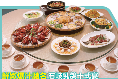
鮮嫩爆汁馳名石岐乳鴿十式宴

菊花宴是一道以櫻菊為主要原料的菜品,也是中山最馳名的菊花系列菜式。都能使每種菜式都有肉的鮮味,同時菊花還具有防風、清熱、解毒、明目的功效,使得菜式不僅美味,還有益健康。