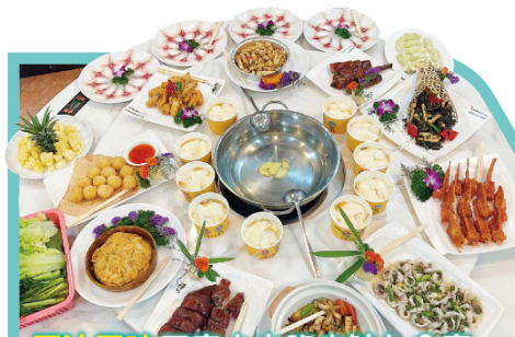
原汁原味 正宗中山脆肉鯪九食宴

東升脆肉鯪養殖歷史悠久,堅持十五年現撈現煮,名副其實的中山特產。其肉質緊實脆爽,清香鮮甜而聞名全國。養殖時間必須三年以上,同時經過120天以上的蠶豆飼養,脆肉鯪最佳食用重量為8-12斤。