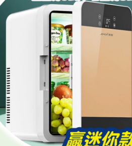
贏迷你款小冰箱 帶返屋企