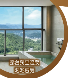
露台獨立溫泉 泡池客房