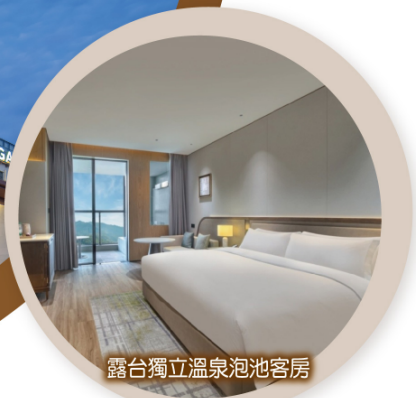
露台獨立溫泉泡池客房