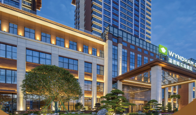
全新開業國際品牌 WYNDHAM GARDEN 新豐新盟溫德姆花園酒店