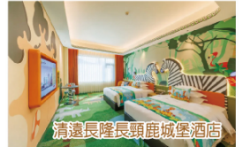
清遠長隆長頸鹿城堡酒店

指定關口集合→乘坐國內旅遊巴→午餐【古法深井燒鵝+特色大煎堆】→重本包入場廣東版小九寨溝《古龍峽玻璃大峽谷》→古龍峽大瀑布群→挑戰12項健力士記錄【雲天玻璃】（包登峰電梯，欣賞世界最大規模高空觀光玻璃組合、世界懸空跨度最長玻璃平台、世界最寬觀瀑玻璃吊橋）→貼心安排專業攝影師【航拍】→晚餐【古龍特色河鮮宴】→入住酒店（保證入住古龍峽景區酒店）