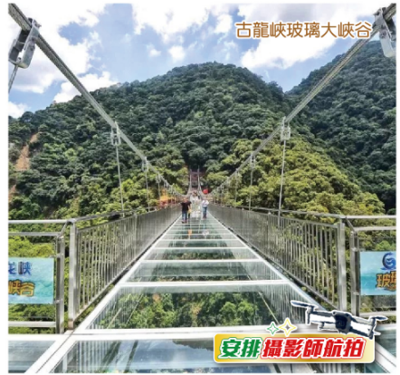
古龍峽玻璃大峽谷