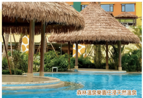
森林溫泉樂園任浸天然溫泉

★貼心安排專業攝影師【航拍】留下美好回憶 ★重本包三大門票：《古龍峽玻璃大峽谷》《清遠長隆森林王國》 《森林溫泉樂園》