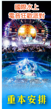
國際水上 電音狂歡派對