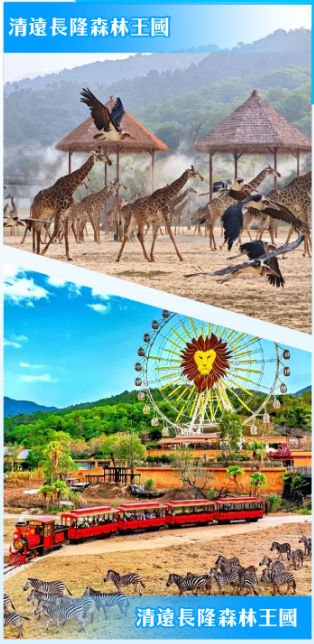
清遠長隆森林王國