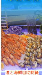
酒店海鮮自助晚餐