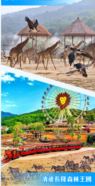
清遠長隆森林王國