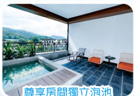
尊享房間獨立泡池

酒店自助早餐→自由活動或繼續享受酒店設施→午餐【普寧古邑珍味宴】(特別準備啤酒放題+冰鎮汽水)→車程約1.5小時→汕尾→【汕尾市博物館】(逢週一閉館則改為汕尾濱海公園)→貼心安排每位貴賓一份潮汕綠豆餅手信→約2.5小時→乘坐國內旅遊巴→送返深圳指定口岸解散