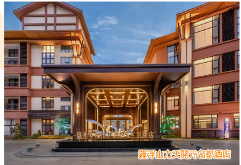
羅浮山力天開元名都酒店