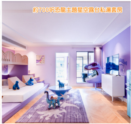
約700呎恐龍主題星空露台私湯套房

第1天 深圳指定口岸集合→乘國內旅遊巴→中華恐龍之鄉·河源→午餐【萬綠湖一品河鮮宴】→重本包門票【河源恐龍博物館】館內藏有豐富的恐龍蛋化石及珍貴的恐龍骨骼化石以及多個恐龍足跡化石→入住酒店2026年全新開業穿越侏羅紀世界【河源春沐源小鎮恐龍溫泉酒店】（安排入住三角龍溫泉套房/蛇頸龍溫泉套房，以當天酒店隨機安排為準）→湖畔船體驗乙次→暢玩龍骨樂園→DIY彩繪恐龍→晚餐【客家薪火鳳鳴雞宴】→觀賞光影水幕秀、煙花表演→任浸富錳鐵質天然棕櫚溫泉或尊享房間星空露台私湯