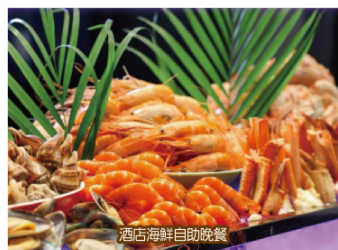
酒店海鮮自助晚餐