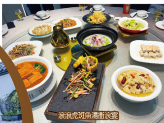
滾滾虎斑魚湯衝浪宴