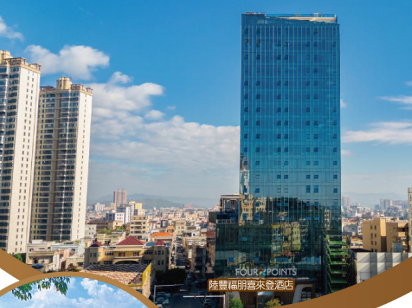
FOUR POINTS 陸豐福朋喜來登酒店