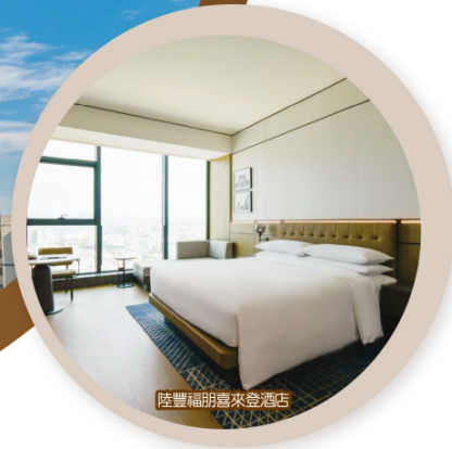
陸豐福朋喜來登酒店