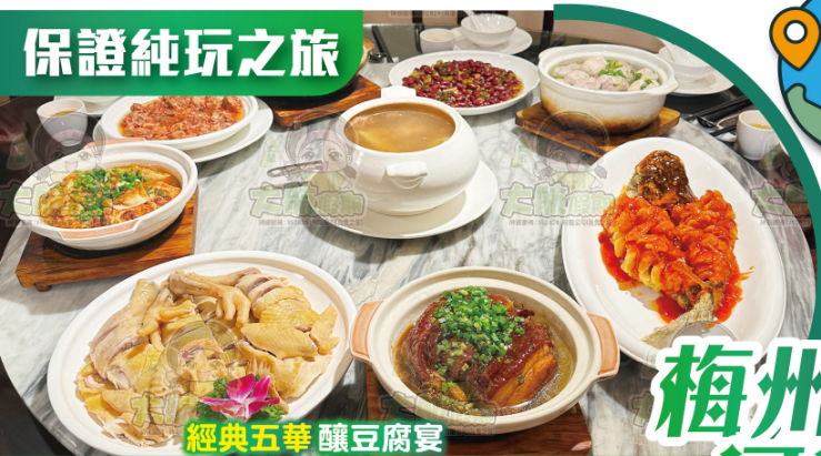
經典五華釀豆腐宴

客家鹹雞精選走地雞鹽水浸煮，皮爽肉嫩帶鹹香；五華釀豆腐以嫩豆腐嵌鮮肉，煎燉後吸滿肉香；五柳魚金黃酥脆、酸甜可口。三道菜香萃客家鮮香，鹹鮮與酸甜交織，各顯風味。